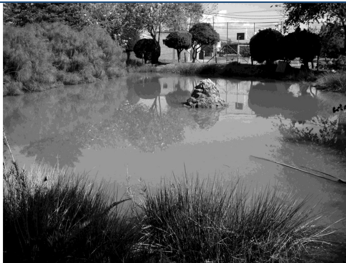
Figura 1. Humedal artificial en el campus sur de la Universidad de Ciencias Aplicadas y Ambientales durante el período de altas precipitaciones en noviembre de 2011. El perímetro del humedal está cubierto por especies nativas y exóticas que son usadas por la gallareta moteada Porphyriops melanops

mientras que después de las hidrófitas nativas hay pasto kikuyo ( Cenchrus clandestinus ), también de origen africano. Alrededor de la malla metálica hay áreas verdes con algunos árboles nativos y exóticos, separados 2-4 m entre sí (Fig. 1). Más allá del área verde hay edificios, salones, parqueaderos y campos deportivos.